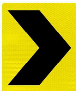
Marcado de alinhamento