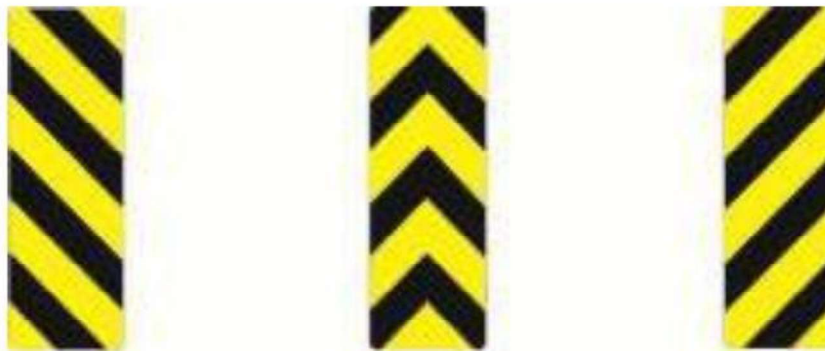
Marcadores de perigo

A Chapa deve ser fabricada em aço galvanizado, cada chapa deverá possuir no mínimo 275 gramas de zinco por metro quadrado, material encruado, semimanufaturado na espessura nominal de 1,25mm (#18) conforme norma NBR 11904:2015 da ABNT.