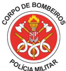
Imagem: brasão CBPMESP

7.2.10.1.3. deverá possuir 02 (dois) brasões atualizados do CBPMESP, nas portas dianteiras, recortados sobre as faixas (dependendo do design do veículo), com a inscrição “CORPO DE BOMBEIROS” e “POLÍCIA MILITAR”, bem como deverá possuir a inscrição da Unidade a qual a viatura pertence;