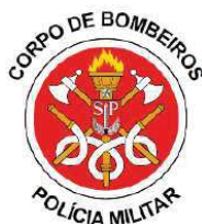
Imagem: brasão CBPMESP

7.2.10.1.3. deverá possuir 02 (dois) brasões atualizados do CBPMESP, nas portas dianteiras, recortados sobre as faixas (dependendo do design do veículo), com a inscrição “CORPO DE BOMBEIROS” e “POLÍCIA MILITAR”, bem como deverá possuir a inscrição da Unidade a qual a viatura pertence;