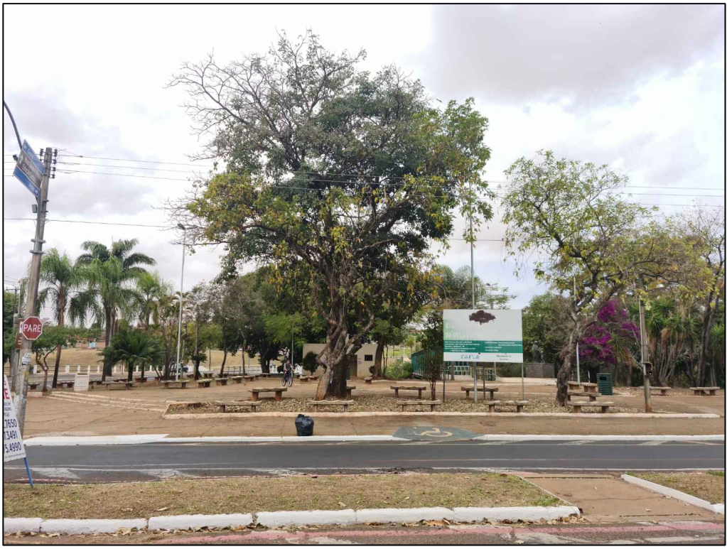
PONTO 1—AV. PREF. HERCULES HORTAL — PAVIMENTAÇÃO DANIFICADA — BANCOS ISOLADOS LIMITADO AO MÁX. DE 3 PESSOAS — DEGRAUS EM TODO O LOCAL — POSTES DE ENERGIA DE AMBULANTES