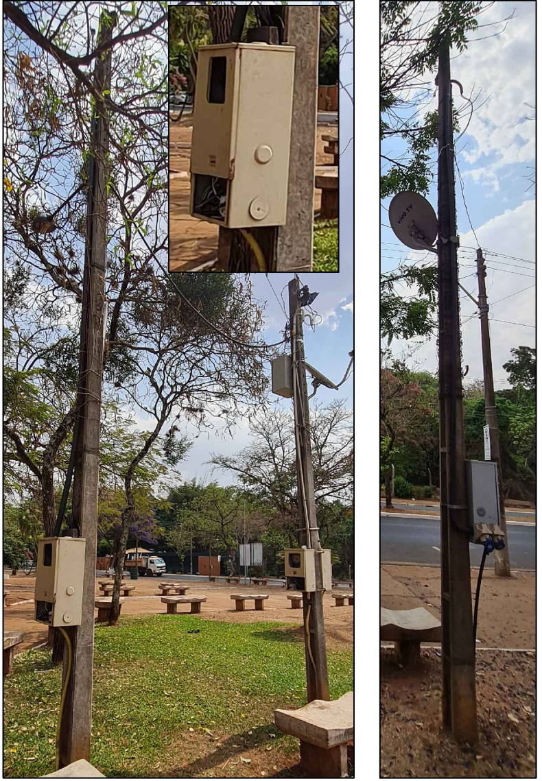
POSTES DE ENERGIA ELÉTRICA — AMBULANTES — POSTES INDIVIDUAIS DE AMBULANTES, SEM PADRONIZAÇÃO. ALGUNS ESTÃO INUTILIZADOS E OS QUE ESTÃO EM USO ESTÃO DANIFICADOS COM A FIAÇÃO EXPOSTA.