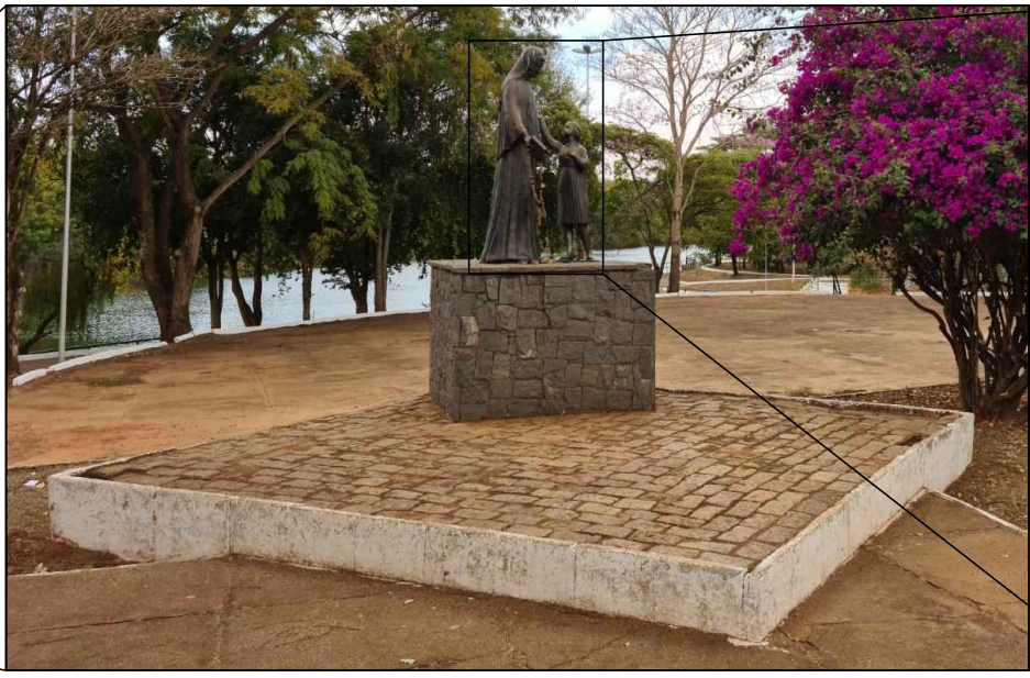
PATAMAR DA SANTA — PATAMAR DESTINADO A SANTA PAULA FRASSINETTI COM PISO EM PARALELEPÍPEDO A SER REAPROVEITADO — BASE DA ESCULTURA EM PEDRA NATURAL A SER REAPROVEITADA — ESCULTURA DE STA. PAULA EM BRONZE A SER REVITALIZADA