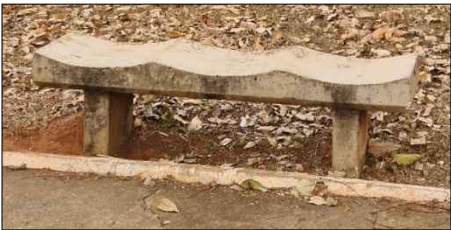
BANCOS A SEREM SUBSTITUÍDOS