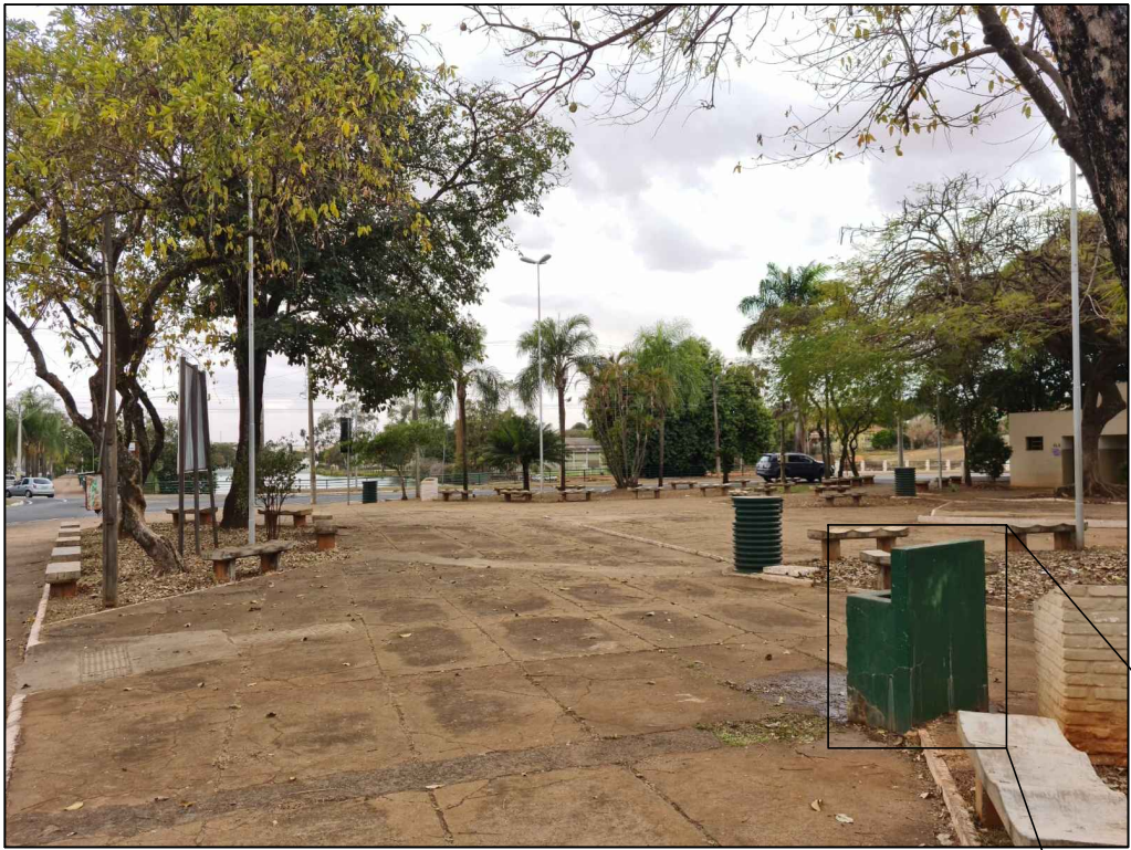
PONTO 4—AV. PREF. HERCULES HORTAL — APESAR DOS DISPOSITIVOS DE ACESSIBILIDADE (RAMPAS) TODA PAVIMENTAÇÃO ESTÁ DANIFICADA — DESNÍVEIS CENTRAIS MARCADOS POR DEGRAUS E PATAMARES — MOBILIÁRIOS SOLTOS (OUTRO MARCO NA PRAÇA LOCADO ATRÁS DO LAVATÓRIO, LIXEIRAS E MAIS POSTES DE AMBULANTES)