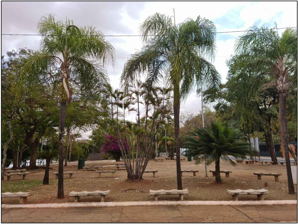
PONTO 3—AV. JOSÉ FRANCISCO PASCHOAL — PAVIMENTAÇÃO DANIFICADA — BANCOS ISOLADOS LIMITADO AO MÁX. DE 3 PESSOAS — PAISAGISMO DEGRADADO E INADEQUADO AO CLIMA LOCAL — IMAGEM DE SANTA PAULA AO FUNDO