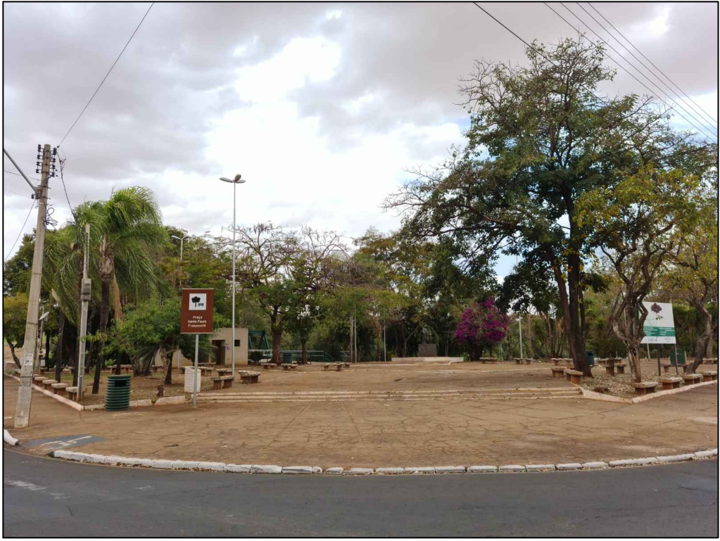
PONTO 2—VISTA DA ROTATÓRIA — PAVIMENTAÇÃO E GUIAS DANIFICADAS — MOBILIÁRIOS SOLTOS (PLACAS DE IDENTIFICAÇÃO, MARCO DA PRAÇA, LIXEIRAS, POSTES DE AMBULANTES) — DEGRAUS NO ACESSO PRINCIPAL — IMAGEM DE SANTA PAULA AO FUNDO