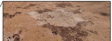
PONTO 6—ÁREA LIVRE PARA O FOOD PARK — TODA PAVIMENTAÇÃO ESTÁ DANIFICADA SEM CIMENTO ADEQUADO PARA ESCOAMENTO DE ÁGUAS PLUVIAIS CAUSANDO EMPOÇAMENTOS — ILUMINAÇÃO ESCASSA — NÃO HÁ LIXEIRAS NO LOCAL — NÃO HÁ PONTOS ENERGIA ELÉTRICA PARA CONEXÃO DOS CARRINHOS DE AMBULANTES