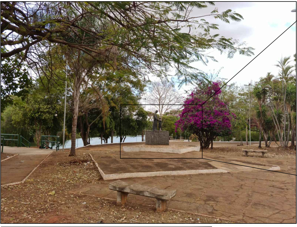
PONTO 5—PATAMARES CENTRAIS — STA. PAULA — APESAR DOS DISPOSITIVOS DE ACESSIBILIDADE (RAMPAS) TODA PAVIMENTAÇÃO ESTÁ DANIFICADA — LOCAL DA SANTA INACESSÍVEL EM PATAMAR — PAISAGISMO DEGRADADO E INADEQUADO AO CLIMA LOCAL