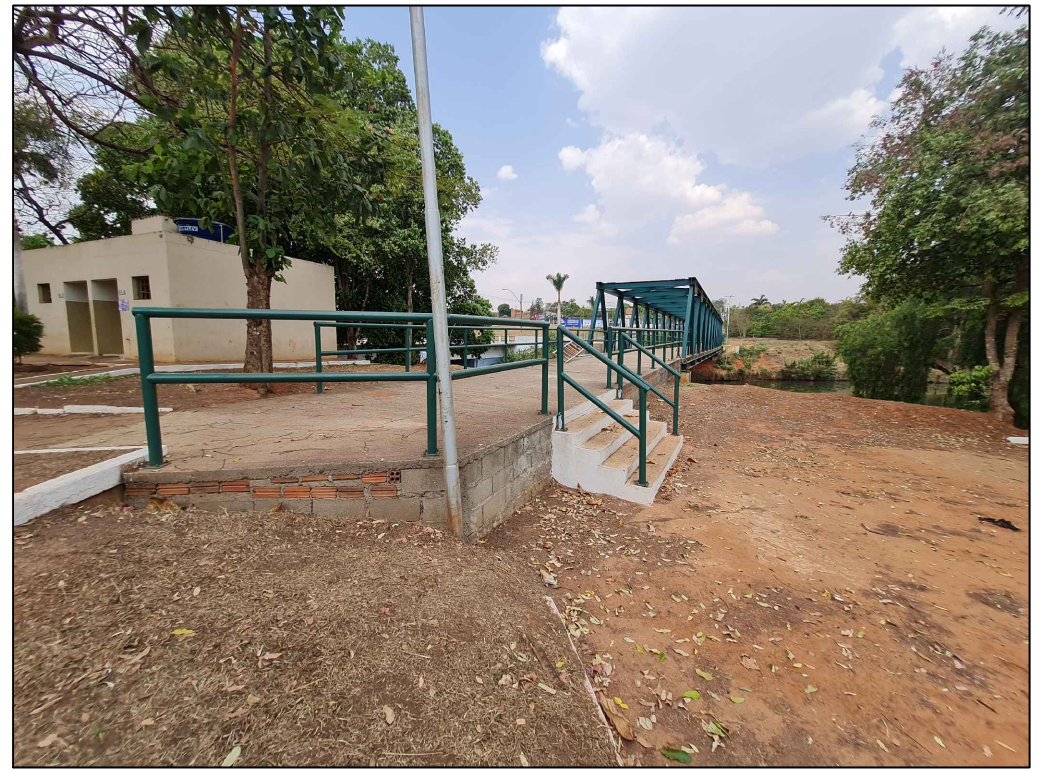
PONTO 7—PASSARELA DE PEDESTRES — PASSARELA EXCLUSIVA DE PEDESTRES/CICLISTAS QUE CONECTA A PRAÇA AO OUTRO LADO DO LAGO ARTIFICIAL — FALTA ACABAMENTO O LOCAL