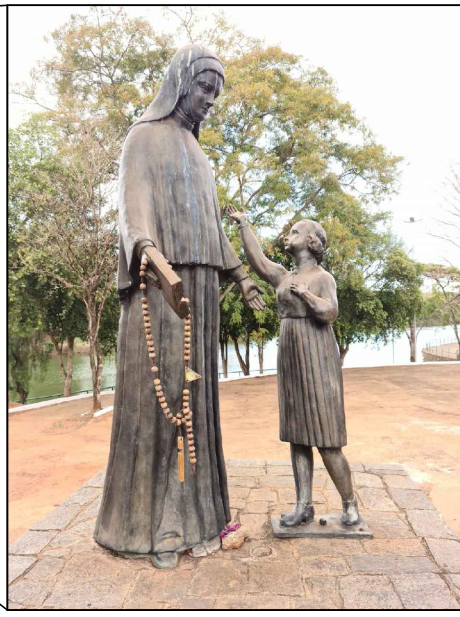
ESCULTURA EM BRONZE