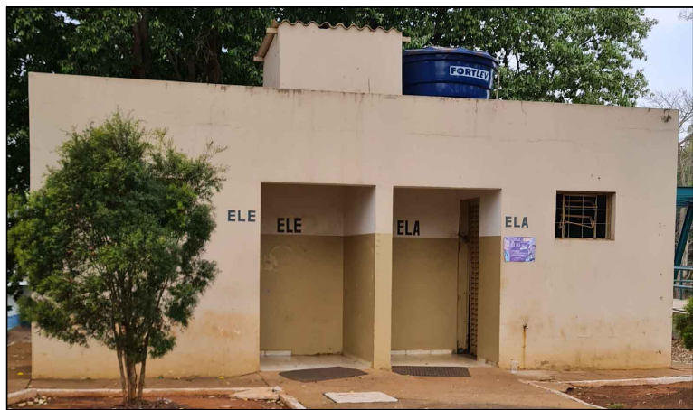
PONTO 8—BANHEIROS — BANHEIROS SEM MANUTENÇÃO, COM ESQUADRIAS DANIFICADAS